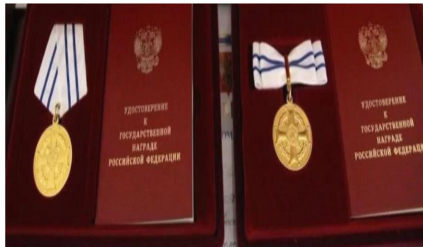
Удостоверение к ордену материнской славы (мужской и женский)