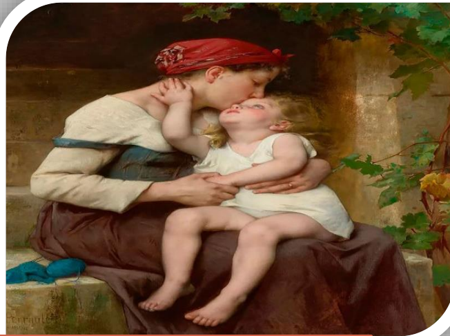
Леон Перро Мать с дочкой