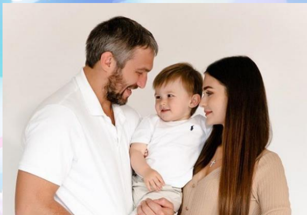
Александр Овечкин и Анастасия Шубская