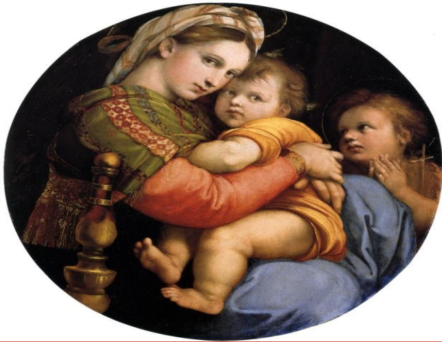
Рембрант Мадонна с младенцем